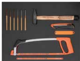
26" PĚNOVÉ MODULY Rozměry 543 x 445 mm

111M – KOMBINOVANÝ KLÍČ 8-10-12-13-14-15-16-17-19