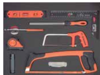
26" PĚNOVÉ MODULY Rozměry 543 x 445 mm

9031 – NASTAVITELNÝ FRANCOUZSKÝ KLÍČ 9031