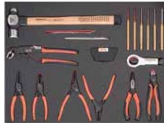
26" PĚNOVÉ MODULY Rozměry 543 x 445 mm