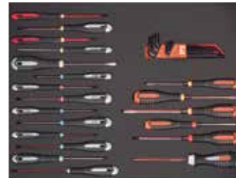
26" PĚNOVÉ MODULY Rozměry 543 x 445 mm