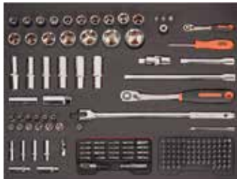
26" PĚNOVÉ MODULY Rozměry 543 x 445 mm