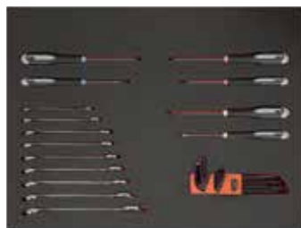
26" PĚNOVÉ MODULY Rozměry 543 x 445 mm