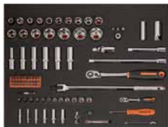
26" PĚNOVÉ MODULY Rozměry 543 x 445 mm