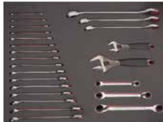
26" PĚNOVÉ MODULY Rozměry 543 x 445 mm